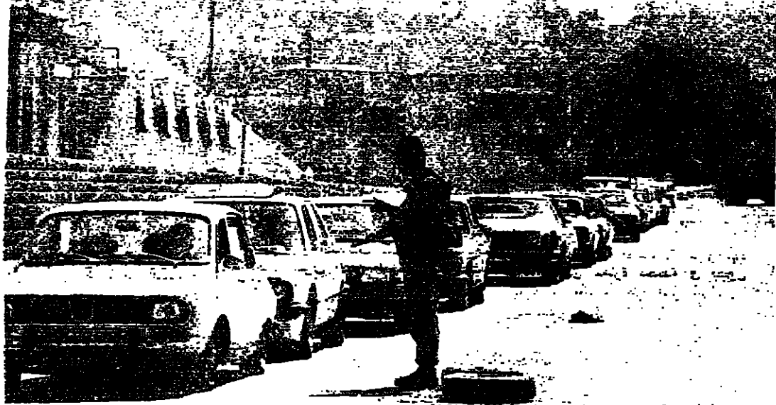
حاجر الضبيبة - نور الكلب